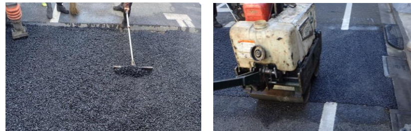
車道アスファルト舗装を新しく舗装する工事